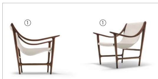
1 Swing 69960 saddle leather milky fin.11